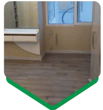
متراژ نصب: ۱۷۳ متر