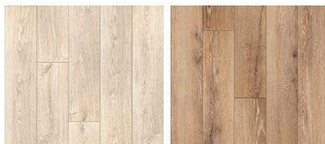
1507. Liva meşe