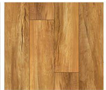
1604. Polar meşe