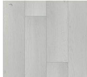
1601. Sofya meşe