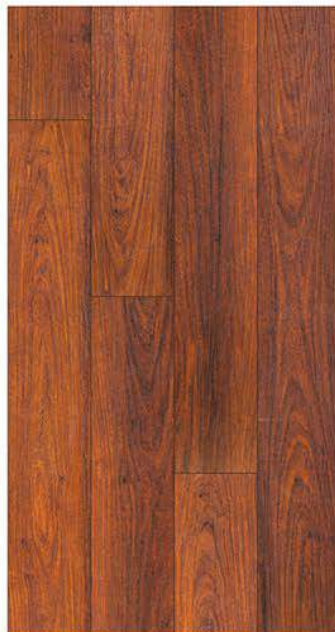
1606. Amerikan çam