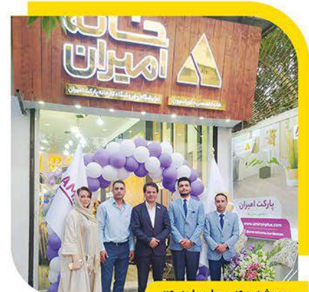
سه شنبه ۴ مردادماه ۱۴۰۱