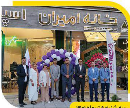
سه شنبه ۶ تیرماه ۱۴۰۱