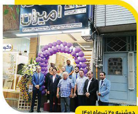
دوشنبه ۲۰ تیرماه ۱۴۰۱