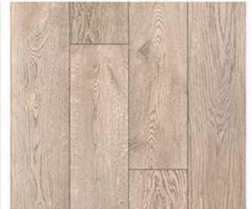
1602. Bati çam