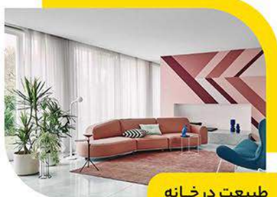
طبیعت در خانه

بعد از همه گیری ویروس کرونا، بیشتر افراد فعالیت‌های خود را به خانه‌هایشان منتقل کرده‌اند به همین دلیل به دکوراسیون خانه‌ها در سال ۲۰۲۲ بیشتر توجه شده است. اگر ما هم بخواهیم با ترند های جدید جلو برویم نیاز داریم که آن‌ها را بدانیم و همسو با آن‌ها پیش برویم. ما هم تصمیم گرفتیم در این مطلب به دکوراسیون جدید منازل در سال ۲۰۲۲ بپردازیم.