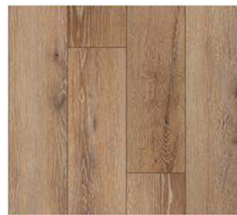
1603. Balkan meşe