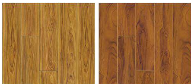
1501. Bal meşe