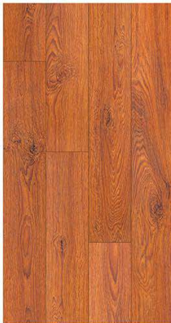
1605. Barok meşe