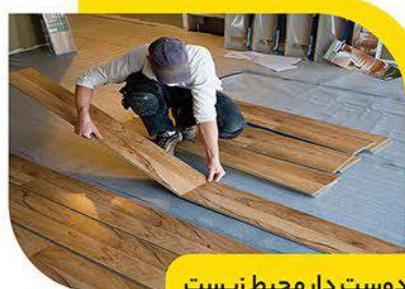
دوست دار محیط زیست

یکی دیگر از موضوعات مطرح شده در دکوراسیون سال ۲۰۲۲ حریم شخصی افراد است. این موضوع مورد بحث قرار گرفته است و در خانه‌ها و سعی می‌شود هر شخصی یک حریم شخصی داشته باشد تا زمان‌هایی را در آرامش و آسایش آنجا سپری کند.