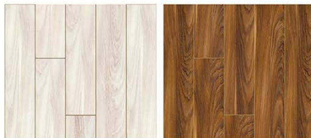
1505. Sadaf meşe