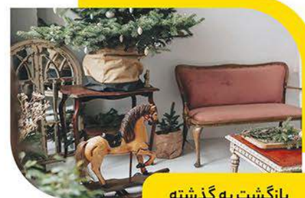
بازگشت به گذشته

از موارد دیگری که در ۲۰۲۲ بسیار توجه شده است، استفاده از مواد و مصالح پایدار است. امروزه به علت افزایش آگاهی و سطح اطلاعات مردم، افرادی که به محیط زیست اهمیت می‌دهند نیز بیشتر شده است. افراد زیادی هستند که به دنبال محصولات با کیفیت می‌باشند تا طول عمر بیشتری داشته باشند.