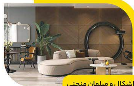
اشکال و مبلمان منحنی

نکته بعدی که به آن می‌توان توجه کرد، رنگ‌ها هستند. در سال ۲۰۲۲ رنگ‌هایی که به طبیعت و خاک بیشتر مربوط هستند مورد توجه می‌باشند. در کل رنگ‌های خنثی بسیار در مرکز توجه هستند. توجه به رنگ‌های گرم و خاکی برای ایجاد فضایی گرم‌تر و راحت‌تر بیشتر است، چون افراد زمان بیشتری را در خانه‌های خود سپری می‌کنند.