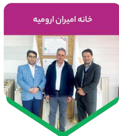
خانه امیران ارومیه