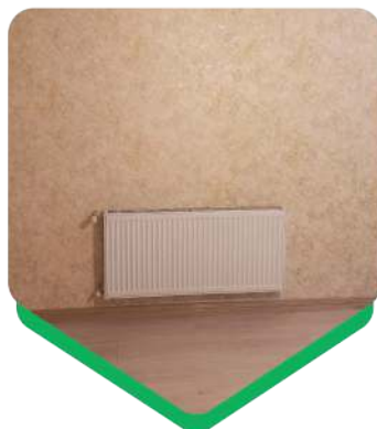
مترائز نصب: ۶۲ متر