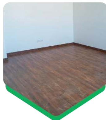
مترائز نصب: ۴۸ متر