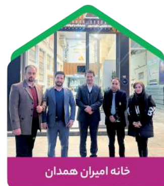
خانه امیران همدان