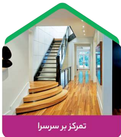
تمرکز بر سرسرا

هنگامی که مردم درگیر همه گیری بیماری کرونا بودند، تغییراتی را در منزل خود به وجود آورده و ارتباط خود را با آن تغییر دادند. پس از چندین ماه قرنطینه، می خواهیم بدانیم این بیماری همه گیر چگونه فضای داخلی خانه ما را تغییر داده است؟ مردم چه چیزهایی را در اولویت قرار داده و چه روند جدیدی رخ داد؟