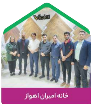
خانه امیران اهواز