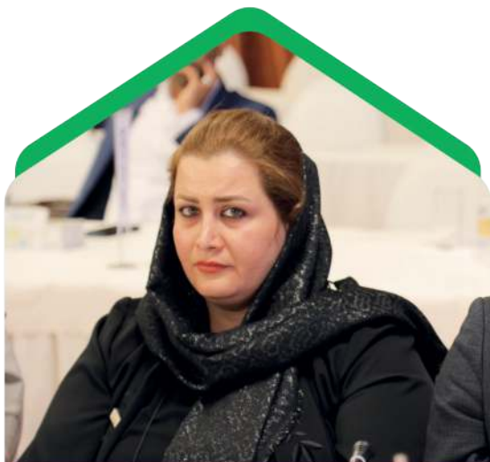
مدیر مسئول: شقایق حاجی پور