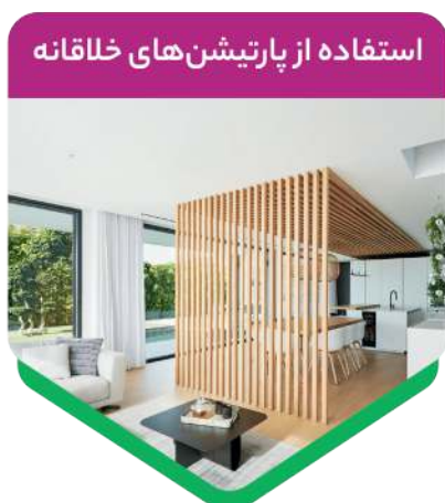
استفاده از پارٹیشن های خلاقانه

در دوران کرونا به علت بسته بودن دفتر سنتی، کار در خانه به یک شغل مستقل تبدیل شده بود. به همین علت، دفاتر خانگی گسترده تر شده و از صندلی های راحت تر و فضای ذخیره سازی بیشتری در آن ها استفاده شده است.