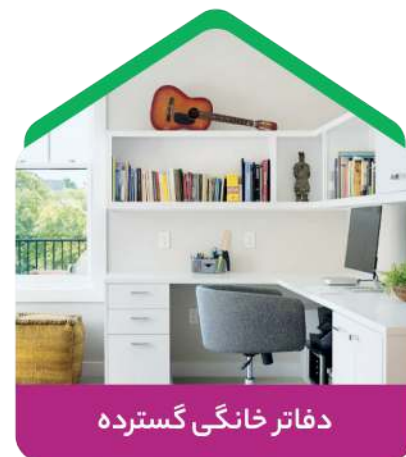
دفتر خانگی گسترده

با انتقال مدرسه به فضای آنلاین، داشتن چندین فضای کاری تعیین شده در خانه برای کاهش حواس پرتی ضروری است. برای این کار، اتاق ها می توانند به دفتر کار خانگی تبدیل شوند یا یک سالن بزرگ تر به این کار اختصاص داده شود.