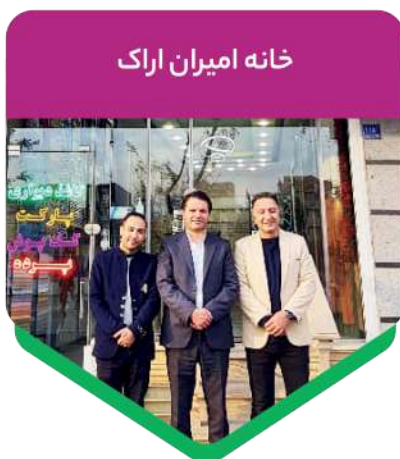
خانه امیران اراک