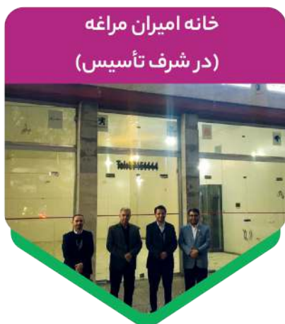
خانه امیران مراغه (در شرف تأسیس)