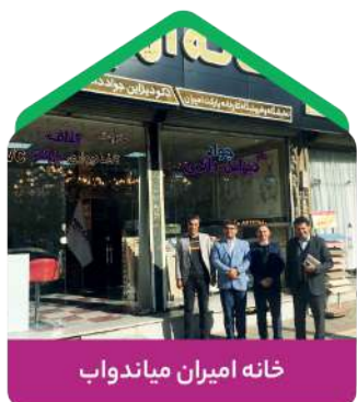
خانه امیران میاندواب

حضور در خانه‌های امیران سراسر کشور و برگزاری جلسات همفکری با همکاران عزیز و رفع موانع و مشکلات احتمالی جزو برنامه‌های آبان ماه تا انتهای سال ۱۴۰۱ بوده و در تلاشیم این جلسات حضوری دارای حداکثر بازدهی برای همکاران عزیز و مصرف‌کنندگان گرامی باشد. این جلسات با حضور مسئولین خانه‌های امیران، مسئولین بلوک‌های فروش و مشاورین شرکت برگزار می‌گردد.