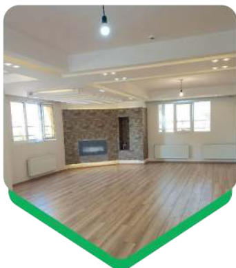
مترائز نصب: ۱۵۴ متر