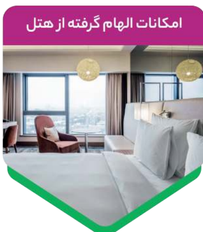
امکانات الهام گرفته از هتل

با توجه به اینکه بیشتر زمان ما در خانه سپری می شود، اهمیت داشتن فضاهای مجزا برای فعالیت های مختلف باعث شده است که از جداکننده ها برای ایجاد انعطاف بیشتر در فضای منزل استفاده کنیم.