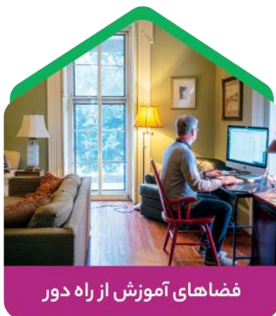
فضاهای آموزش از راه دور

در روزهای کرونایی به ورودی ها، سرسراها و گلخانه ها توجه بیشتری میشد، زیرا بهداشت محیط اهمیت زیادی برای مردم داشت و از فضاهای باز برای افزایش جریان هوا و انتقال کمتر ویروس استفاده میشد.