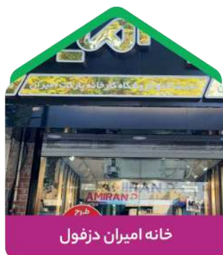
خانه امیران دزفول