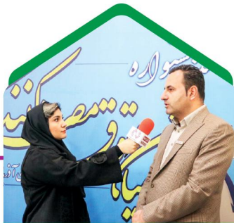
مصاحبه با خبرگزاری‌ها