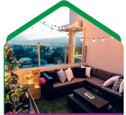
توجه به روشنایی محیط

ممکن است از فضای شهری خسته شده باشید که در این صورت به آسانی با ایجاد یک گوشه دنج در خانه مثل بالکن، برای چند دقیقه و حتی در ایام تعطیلی چند ساعت خود را در فضای غیر رسمی و راحت غرق کنید.