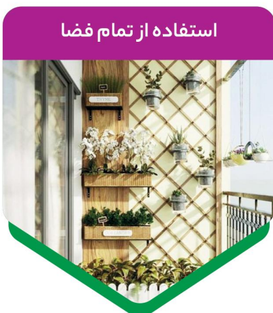
استفاده از تمام فضا

به وجود یک میز برای صرف غذای مورد علاقه‌تان در فضای خارج از دیوارهای خانه نیاز دارید. این میز می‌تواند یک بلوک صیقل خورده سیمانی یا یک میز نجاری شده توسط خودتان باشد که با توجه به بودجه شما در این فضا تعبیه می‌شود.