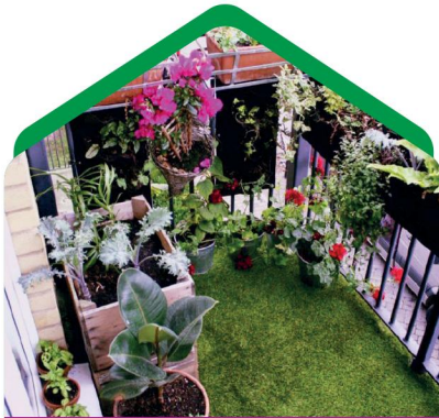
افزودن گل و گیاه

بالکن، یک آپشن فوق العاده برای ساکنین آپارتمان‌ها، به خصوص در آپارتمان‌هایی با متراژ کوچک‌تر است. چرا که تصویری از یک حیاط هرچند محدود هم برای کسانی که در ارتفاع‌هایی بالاتر از سطح زمین قرار دارند؛ احساس خوشایندی ایجاد می‌کند. امروزه بالکن‌ها با دارا بودن دکوراسیون‌های منحصر به فرد خود در هر خانه، نشان دهنده خوش سلیقه‌گی ساکنین آن خانه هستند که زیبایی آن، هم شامل نمای ساختمان و هم فضای داخلی‌تان می‌شود. در ادامه دوازده نکته برای طراحی یک بالکن رویایی را در اختیارتان قرار خواهیم داد.