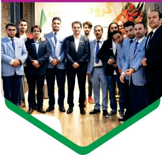
حضور در نمایشگاه‌ها