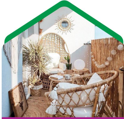
استفاده از یک وسیله خاص

اگر فضای کمی دارید یا همیشه نمی‌خواهید روی صندلی بنشینید، سعی کنید مبلمان یا میزهایی را نصب کنید که در صورت عدم استفاده قابل جمع شدن یا فشرده شدن باشند. در این صورت فضای خود را به تغییر دو حالت مجهز کرده‌اید.