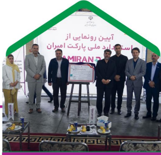
دریافت تأییدیه ملی و بین‌المللی