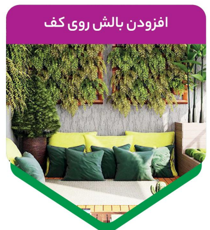
افزودن بالش روی کف

لازم نیست تمام کف بالکن را فرش ببندازید. فرش یا گلیمی کوچک کفایت فضای‌تان را چهارچوب دهد و رنگ بخشد. فرشی انتخاب کنید که در برابر عناصری چون باد و باران و آفتاب مستقیم مقاومت بالایی داشته باشد.