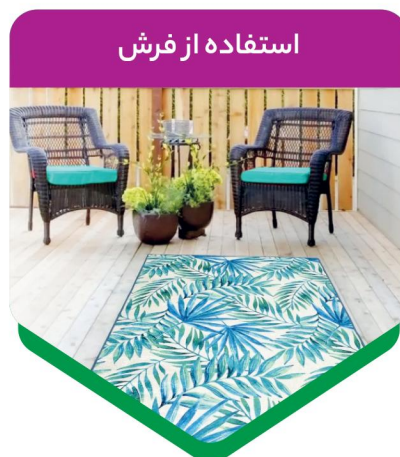
استفاده از فرش

گل‌دان‌ها یا آویزهای تزئینی خاص و البته سبک را از سقف و دیوارها بیاویزید و فضا را هنری کنید. دقت کنید نصب این اکسسوری‌ها باید به اندازه کافی با دقت انجام شود تا کاملا فیکس شوند و امکان افتادن را به حداقل برسانند.