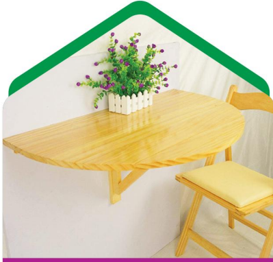
استفاده از لوازم تاشو

اگر فضای کمی دارید یا همیشه نمی‌خواهید روی صندلی بنشینید، سعی کنید مبلمان یا میزهایی را نصب کنید که در صورت عدم استفاده قابل جمع شدن یا فشرده شدن باشند. در این صورت فضای خود را به تغییر دو حالت مجهز کرده‌اید.