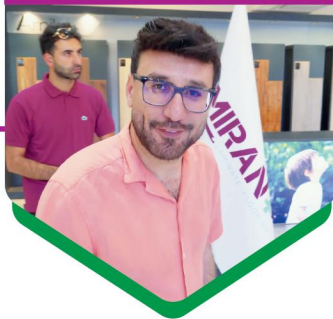
حضور سلبیتری‌ها و بلاگرها