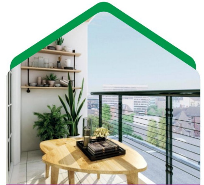
انتخاب یک میز مناسب

اگر فضای کوچکی دارید می‌توانید از صندلی‌های متصل به دیوار هم استفاده کنید. باد و باران‌های شدید و تابش مستقیم آفتاب را فراموش نکنید. این عوامل می‌توانند مبلمان غیر قابل شستشو را برای همیشه زشت کنند.