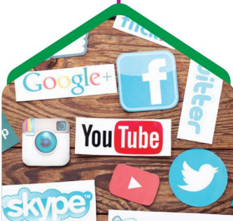
حضور فعال در شبکه‌های اجتماعی