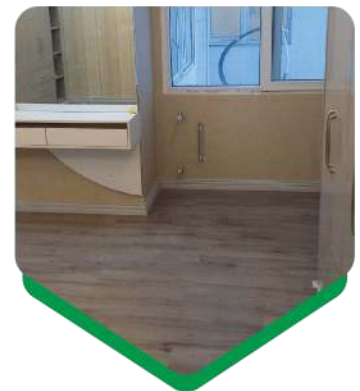
متراژ نصب: ۱۷۳ متر