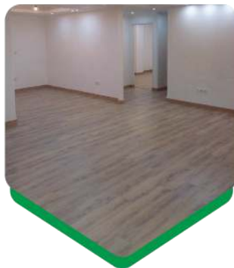
متراژ نصب: ۸۶ متر