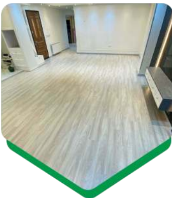
متراژ نصب: ۷۳ متر