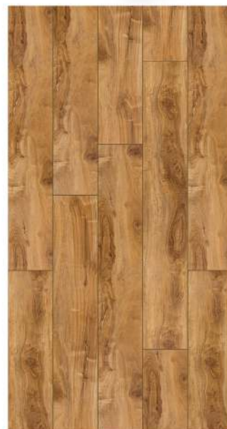
1211. Natural Çam