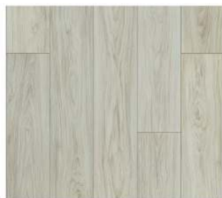
1212. Antik Meşe