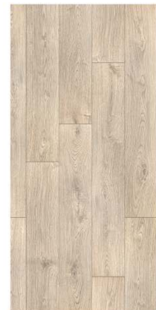
1209. Liva meşe