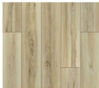
1210. Kristal Meşe