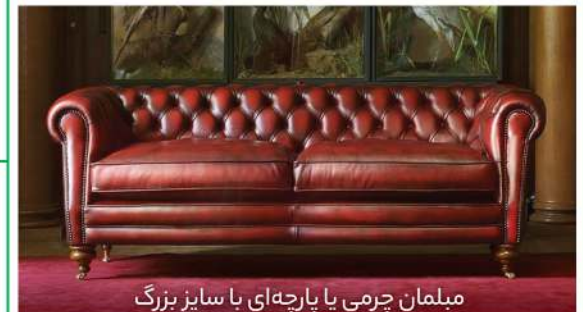
مبلمان چرمی یا پارچه‌ای با سایز بزرگ