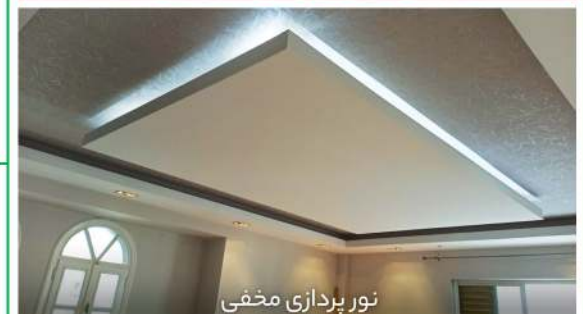
نور پردازی مخفی