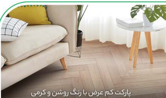
پارکت کم عرض با رنگ روشن و گرمی