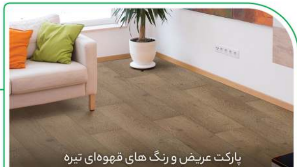
پارکت عریض و رنگ های قهوه‌ای تیره