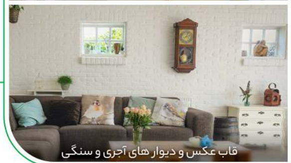
قاب عکس و دیوار های آجری و سنگی