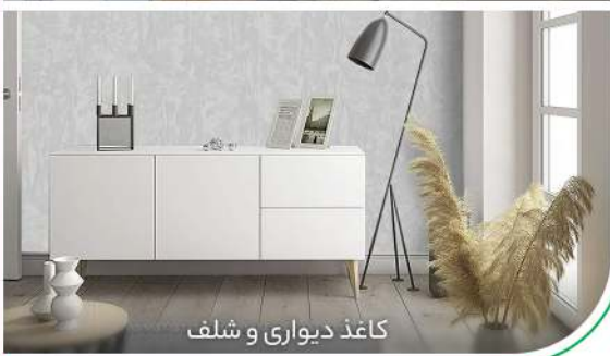
کاغذ دیواری و شلف