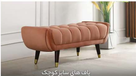
پاف های سایز کوچک